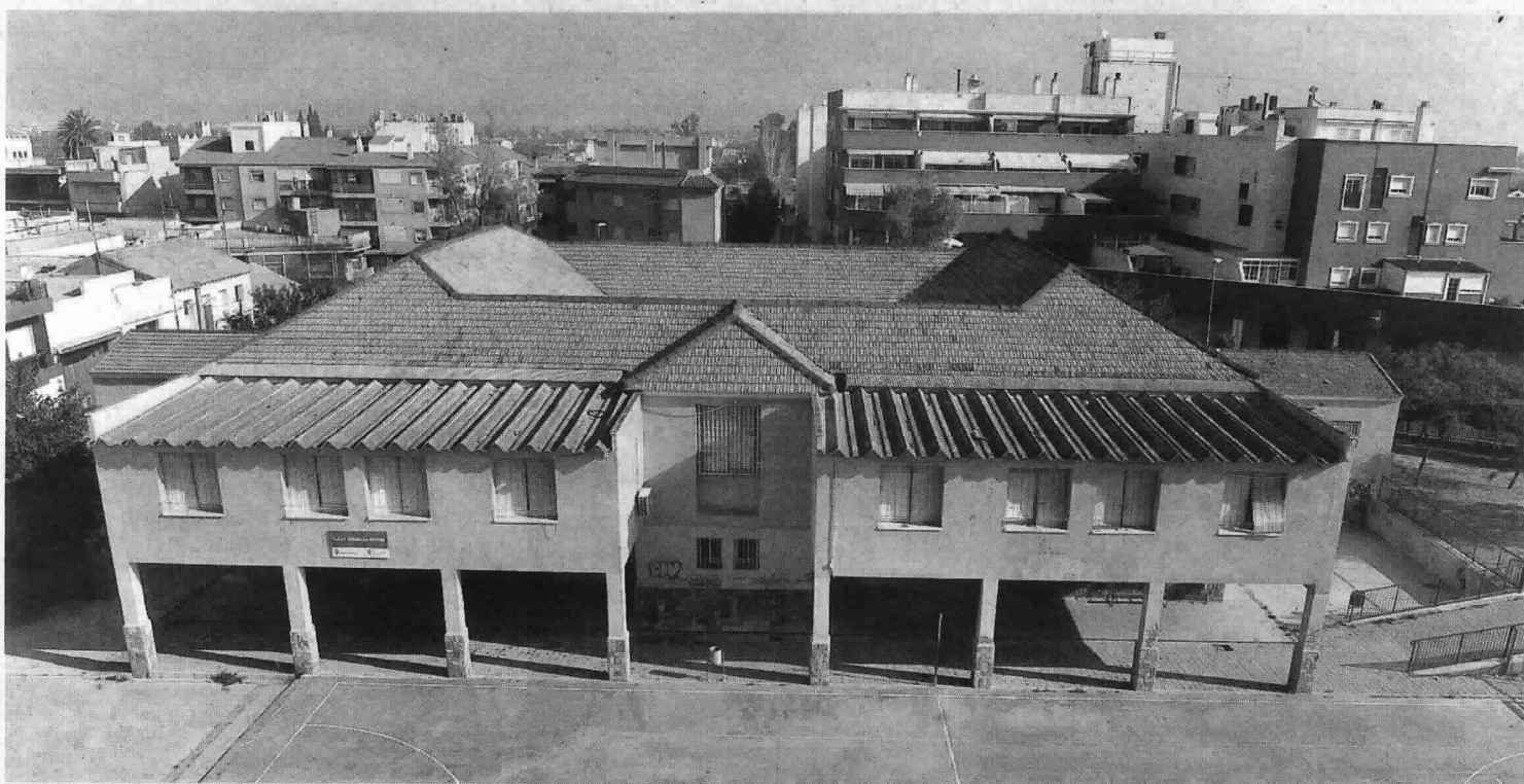
Panorámica del colegio Escuelas Nuevas de El Palmar, clausurado hace tres años tras su declaración de ruina.

En junio de 2011 la Asociación de Padres y Madres de Alumnos recibió una comunicación del Ayunta-