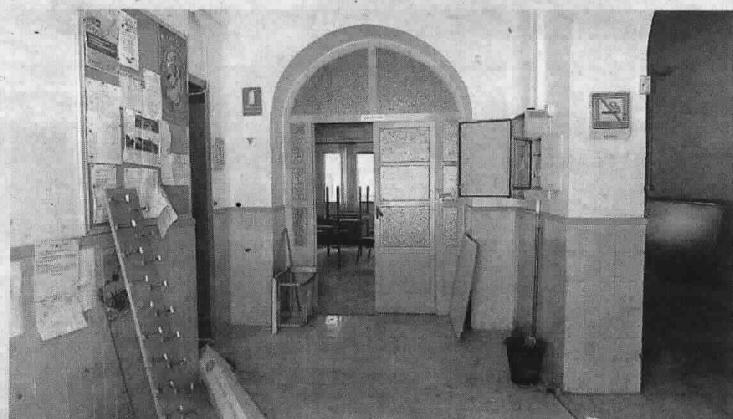
El centro todavía conserva por dentro su aspecto original.

mar. Origen, desarrollo y evolución' en la que recoge que las Escuelas Nuevas para muchos palmareños son algo más que «cuatro piedras viejas». Según Jiménez, «es el único edificio civil y público de El Palmar que tiene más de 70 años y que según el Catastro está en uso de enseñanza y normal y ha formado y conformado nuestra vidas; los centros escolares son parte esencial